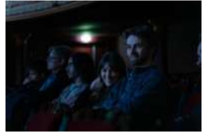
Le jury et les coulisses