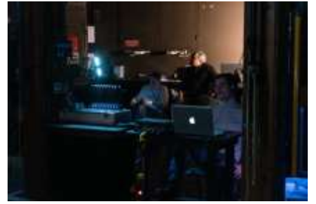
Chut... on enregistre....